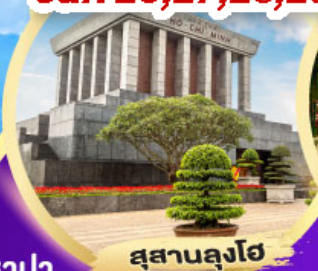
สุสานลุงโฮ