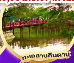
ทะเลสาบคินคาบ