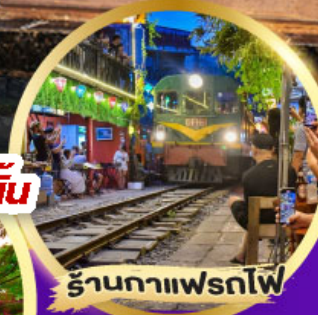
ร้านอาหารเฟรทไฟ