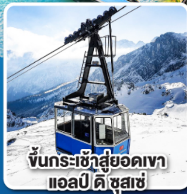
ขึ้นกระเช้าสู่ออดเขา แอลปี ดิ ซูสแซ่

เที่ยวเมืองอินส์บรุค เพชรเม็ดงามสุดโรแมนติก แห่งแคว้นทิโรล ราคาเริ่มต้น