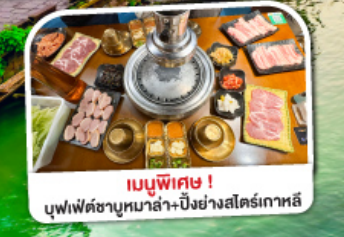
เมนูพิเศษ! บุฟเฟ่ต์ชาบูหม่าล่า-ปิ้งย่างสไตล์เกาหลี