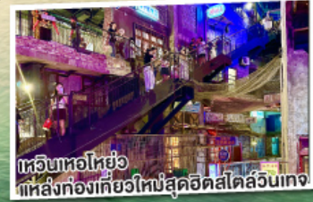
เทวีนหอไหย่ แหล่งท่องเที่ยวใหม่สุดฮิตสไตล์ลูนเทจ