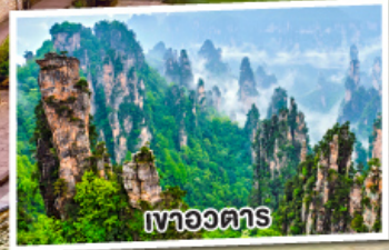
เหวอวตาร