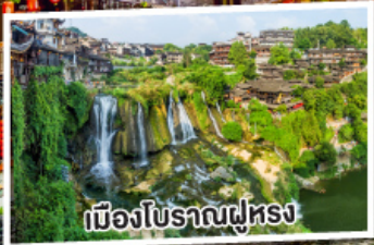
เมืองโบราณฟูหรง