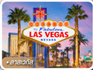
ลาสเวกัส