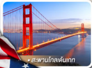
สะพานโกลเดนเกต

★ เยือนอุทยานแกรนด์แคนยอน ฝั่ง South rim ความมหัศจรรย์ทางธรรมชาติที่ยิ่งใหญ่ที่สุดแห่งหนึ่งของโลก