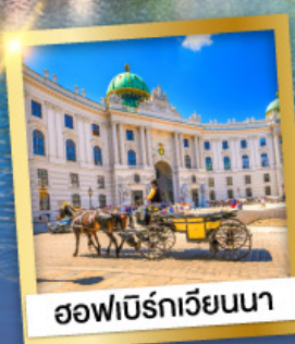
ออฟฟิเบิร์กเวียนนา