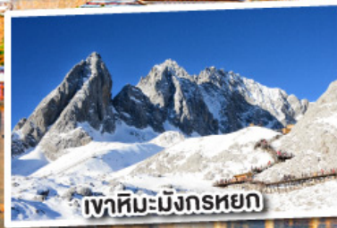
เขาสหิมะมังกรหยก