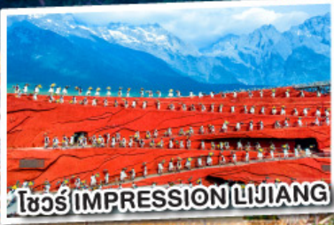
โซ่ว IMPRESSION LIJIANG