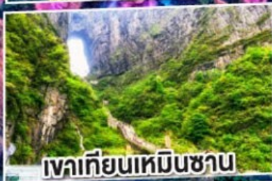
เวาเทียนเหมินซาน