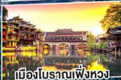
เมืองโบราณฝูหรง