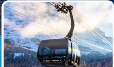
กระเช้า ไอเกอร์เอ็กสเพรส สู่อยอดเขาจุงเฟรา

อิตาลี สวิตเซอร์แลนด์ ฝรั่งเศส 10 วัน 7 คืน