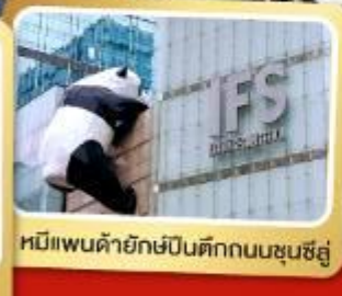
หมีแพนด้ายักษ์ปีนตึกถนนชุนชู่