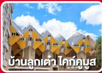
บ้านลูกเต่า ไคท์คูบัส