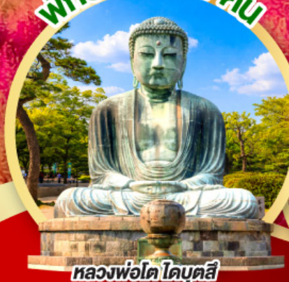
หลวงพ่อดโต โดบุตสึ