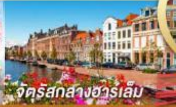
จัตุรัสกลางฮาร์เล็ม