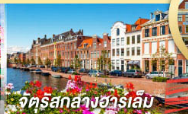
จัตุรัสกลางฮาร์เล็ม