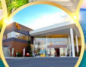
มิตซึยะ เอาท์เล็ตพาร์ค คาโดมะ