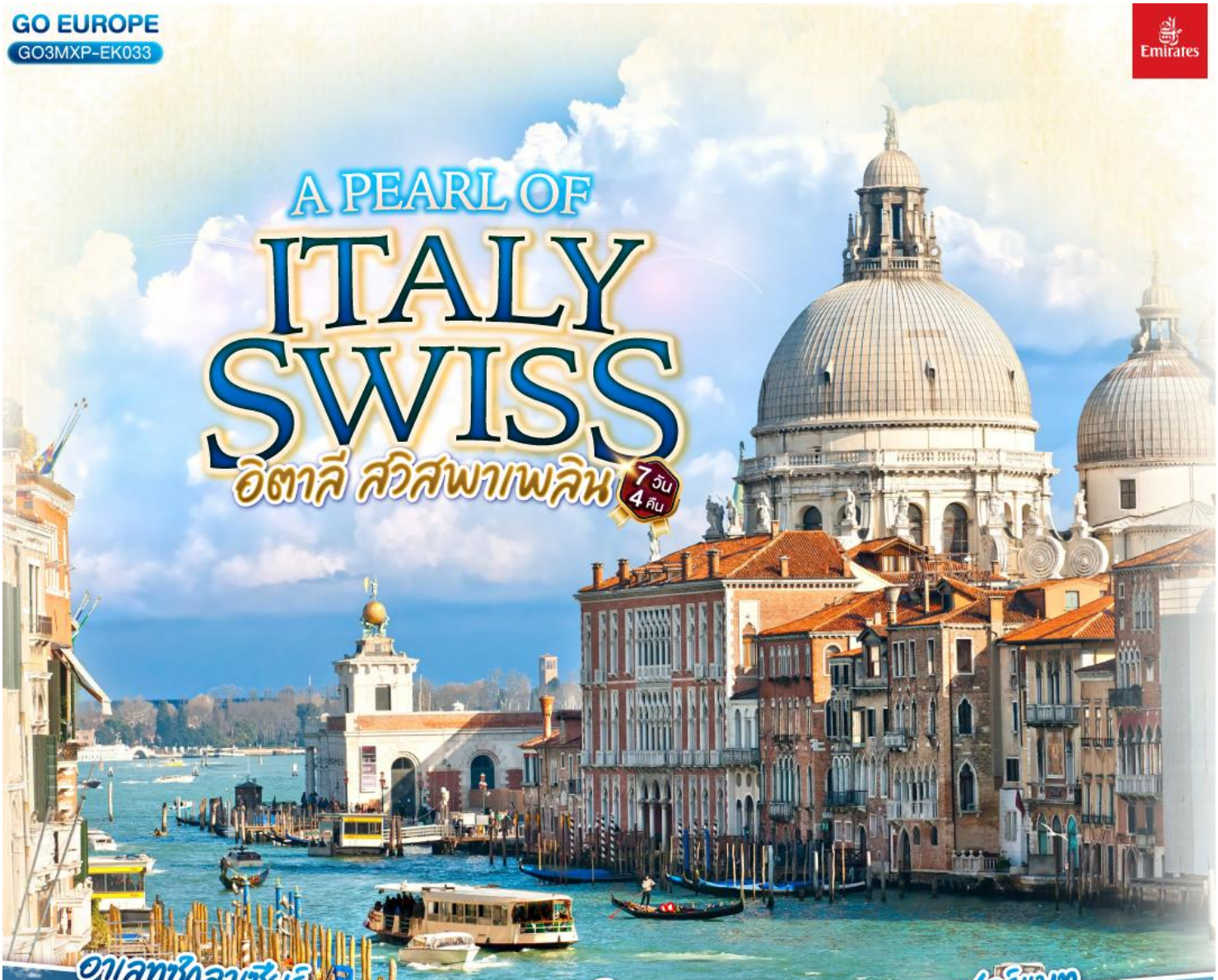
อालป์ชิลลาเซียร์