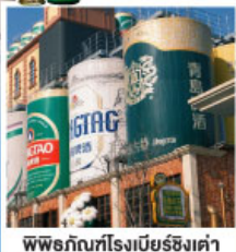
พิพิธภัณฑ์โรงเบียร์ชิงเต่า