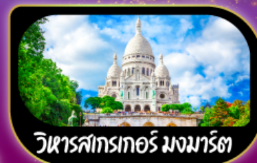
วิหารสกรเกอร์ มงมาร์ต