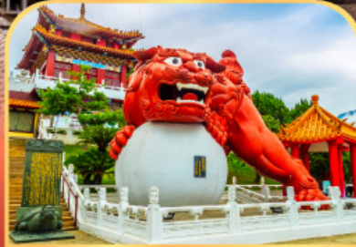
วัดเหวินหู