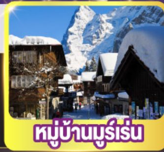
หมู่บ้านมูร์เรน