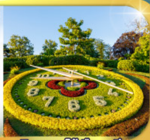
นาฬิกาดอกไม้เมืองเจนีวา