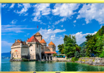
ปราสาทชิลยง