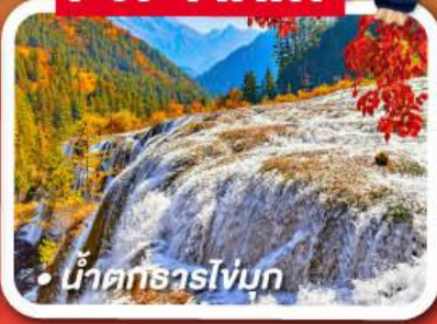
น้ำตกธารไข่มุก