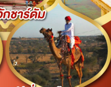
ฟรี ขี่อูฐ เมืองมันทวา ราคาเริ่มต้น