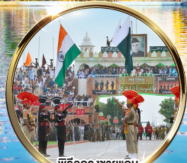
พิธีลดธงชัยแค้ม อินเดีย-ปากีสถาน ค่านวาทาร์