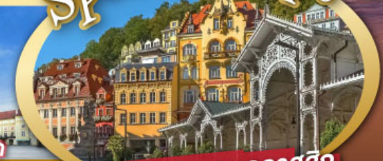
ชมสถาปัตยกรรมคลาสสิก เมือง คาร์โลวี วารี