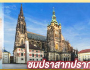
ชมปราสาทปราก