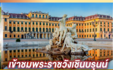
เข้าชมพระราชวังฮินบรุนน์