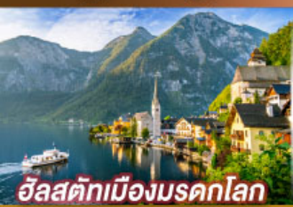
อิลสติกเมืองมรดกโลก