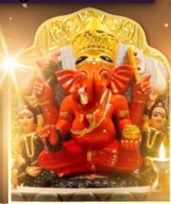
องค์สิทธินายิก