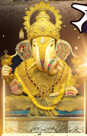
องค์ดีกษุทีพิเศษ