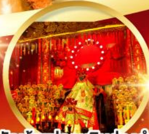
วัดเจ้าแม่กวนอิมย้งอ่า