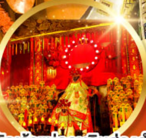
วัดเจ้าแม่กวนอิมฮ้องอำ (สวนหนานเท่ลิย)