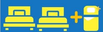
เตียง 3 ท่าน ที่นอนเสริม TRIPLE