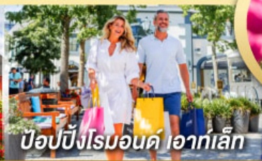
ปิ๊อปบิงโรมอนด์ ไอเกิ้ล