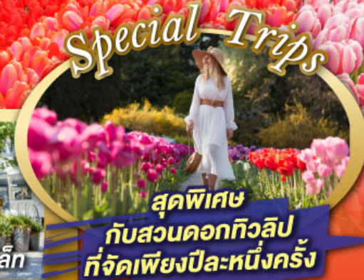
สุดพิเศษ กับสวนดอกทิวลิป ที่จัดเพียงปีละหนึ่งครั้ง