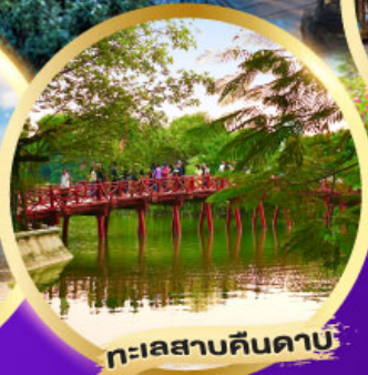
ทะเลสาบคินคาบ