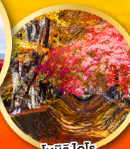
โมมิจิ โคโร อุโมงค์ใบเมเปิ้ล

ลดราคา 3,000.- ปกติ 60,900.- 07-13 พ.ย. 67 57,900.- เหลือเพียง