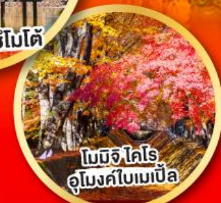
โมมิจิ ไคโร อุโมงค์ใบเมเปิ้ล