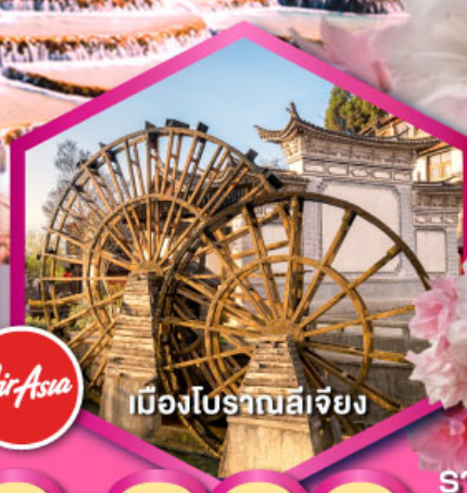
เมืองโบราณลีเจียง