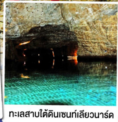
ทะเลสาบไ้ดินเซนที่เล็ยวาร์ด

ล่องเรือชมทะเลสาบไ้ดินเซนที่เล็ยวาร์ด ทะเลสาบไ้ดินลึกลับ สุดUnseenแห่งสวิตเซอร์แลนด์