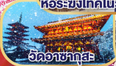
วดอซกุกุสะ