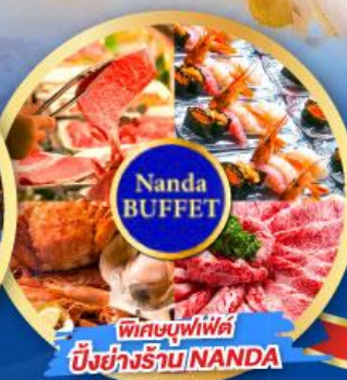
พิเศษบุฟเฟ่ต์ บึงย่างร้าน NANDA

เดินทาง (วันปีใหม่ 2568) 27 ธ.ค.-01 ม.ค. 68 29 ธ.ค.-03 ม.ค. 68