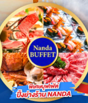
พิเศษบุฟเฟ่ต์ บึงย่างร้าน NANDA