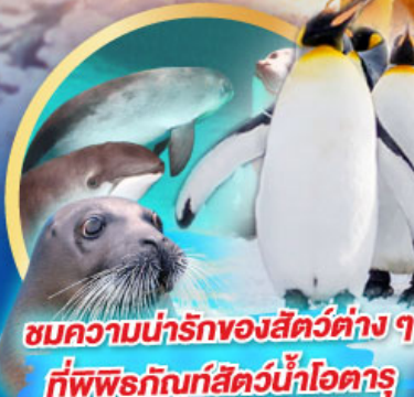
ชมความน่ารักของสัตว์ต่าง ๆ ที่พิพิธภัณฑ์สัตว์น้ำโฮตารุ