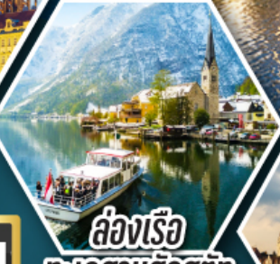
ล่องเรือ ทะเลสาบอัลสติก