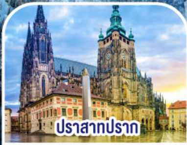
ปราสาทปราก