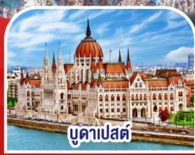
บูดาเปสต์

✓ พักอัลสตัด ✓ ขึ้นยอดเขาชุกสปีตซ์ เริ่มต้น TOP OF GERMANY