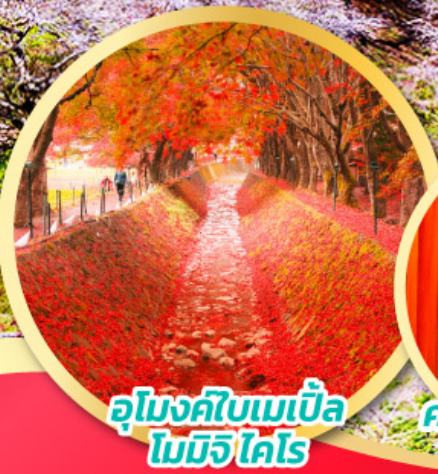
อุโมงค์ใบเมเปิ้ล โมมิจิ ไคโร