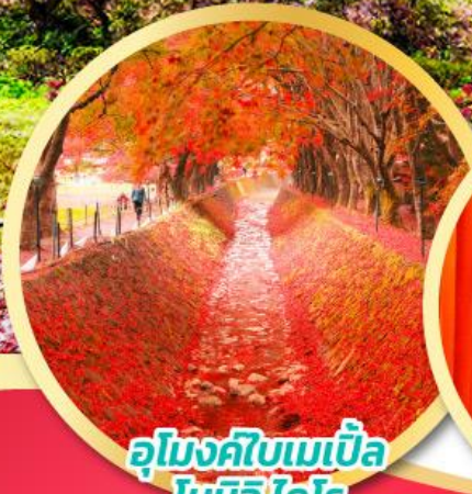
อุโมงค์ใบเมเปิ้ล โมมิจิ ไคโระ