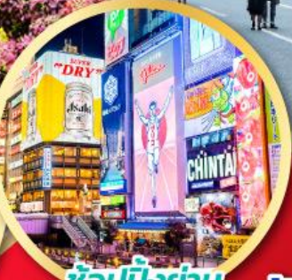
ช้อปปิ้งย่าน ชินโซบาชิ