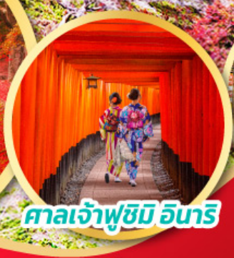
ศาลเจ้าฟูชิมิ อินาริ