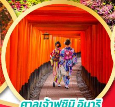
ศาลเจ้าฟูชิมิ อินาริ