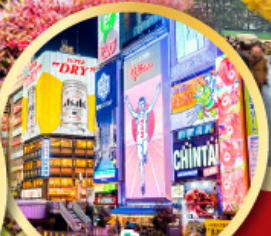
ช้อปปิ้งย่านชินโซบาสึ