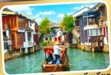
ล่องเรือเมืองโบราณซูเจียเจียว