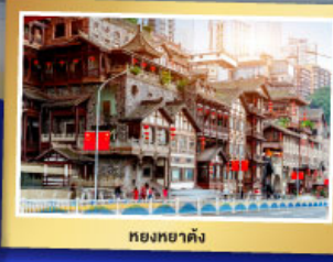
หยงหยาดัง