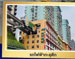
รถไฟฟ้า-ลูตึก