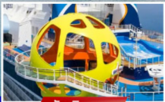
วันเดินทาง