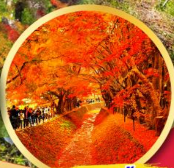
อุโมงค์ใบเมเปิ้ล โมมิจิ โคโร