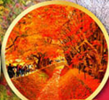
อุโมงค์ใบเมเปิ้ล โมมิจิ ไคโร