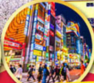
ช้อปปิ้ง ย่านชินจูกุ

พักออนเซ็น 1 คืน , พักโตเกียว 2 คืน บินเข้านาโกย่า-ออกโตเกียว