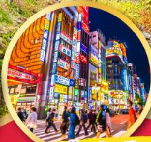
ช้อปปิ้ง ย่านชินจูกุ