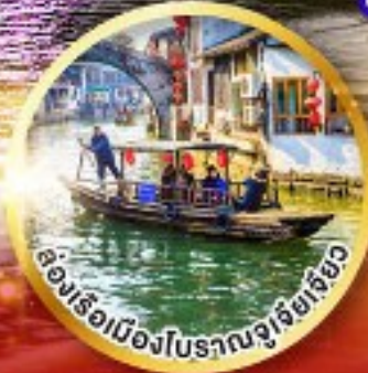
ล่องเรือเมืองโบราณซูโจว