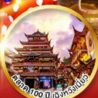
ศาลา 100 ปี เติ้งหวงเป่ย์จิว