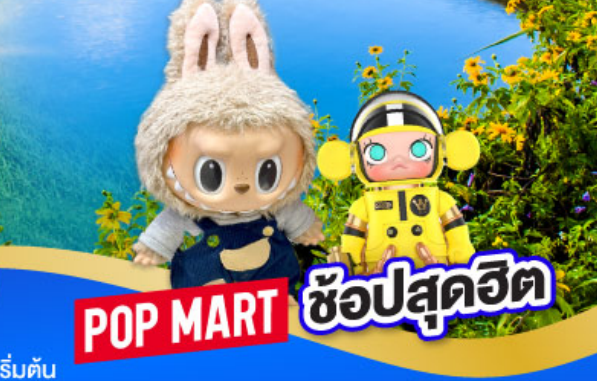
POP MART ซ้อปสุดฮิต