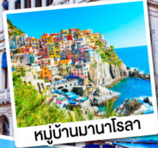
หมู่บ้านมานาโรลา

เที่ยวเก็บครบไฮไลต์โดโลไมท์ ทั้งทะเลสาบมิสุรีน่า