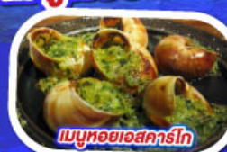
เมนูหอยแอสคาร์โท