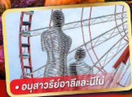
• อนุสาวรีย์อาลีและนีโอบี