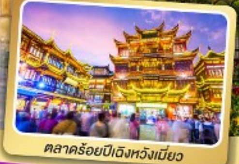
ตลาดร้อยปีดิ้งหวงเหมียว