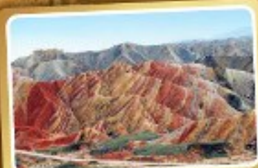
ภูเขาทรายรุ้งจางเย่