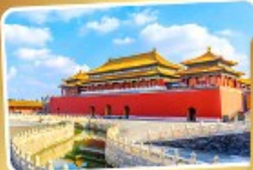
พระราชวังโบราณตู่กิง