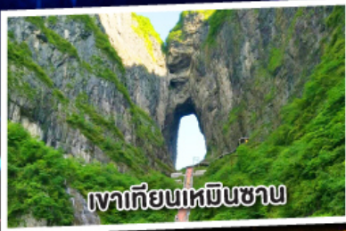
เขาเทียนเหมินซาน