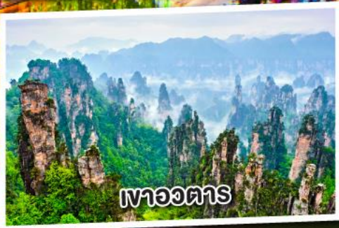
เขาอวดตาร