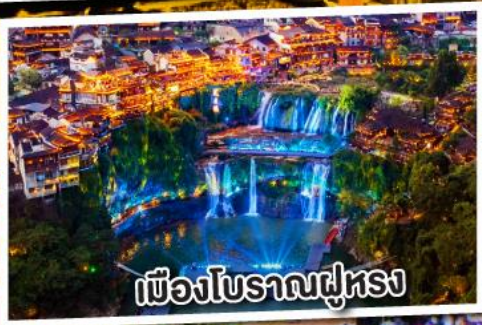
เมืองโบราณฝูหลง