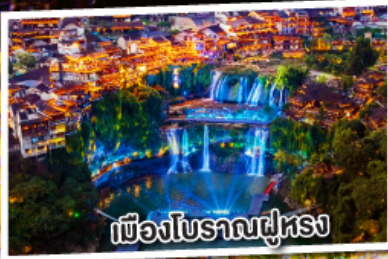
เมืองโบราณฝูหรง