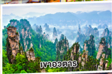
เขาอวตาร