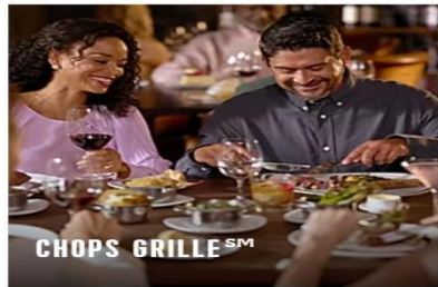
CHOPS GRILLE SM